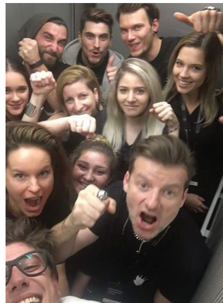
Ekipa frizerjev Mare dresura frizure.

večini dolgi in nebarvani. Pričeske so bile raznolike in prilagojene kreatorjevimi zahtevam. Lahko pa rečem, da so bile pričeske zelo mehke in ne strogo začesane. Dosti je bilo raznih vrst čopov in veliko spuščениh las, ki so dajali občutek neurejenosti in mehke. Moški pa so bili zelo moški, strogo začesani, s prečko in veliko 'wet looka'.«